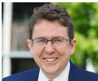
Albert Rösti Président d'auto-suisse