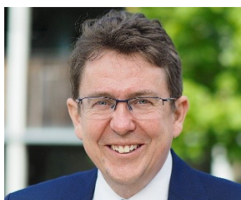
Albert Rösti Präsident auto-schweiz

auto-schweiz wünscht frohe Weihnachten und ein gutes, gesundes neues Jahr