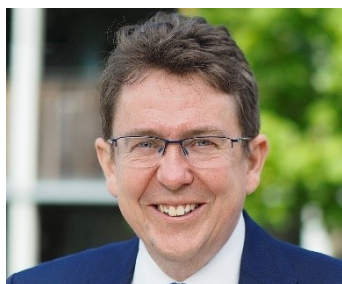
Albert Rösti Président d'auto-suisse

auto-suisse souhaite de joyeuses fêtes et beaucoup de bonheur et de santé en 2023